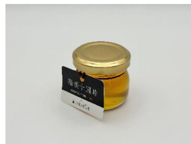
<地産品のイメージ>