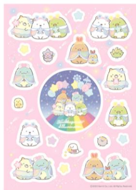
キラキラシール 税込 650 円

イルミネーションを楽しむすみっこたちがかわいく描かれたイラストをあしらったオリジナルグッズに、すみっこたちのキラキラシール、お洋服やカバンのアクセントにもなるピンバッジ、ブラインドアクリルスタンドの3種が、新たに登場します。※3月中旬より順次販売開始いたします。