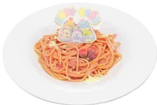
さくらカルボナーラ 税込 1,700 円

レストラン「ワイルドダイニング」では、桜をモチーフにしたピンク色のかわいらしいフードやドリンクが登場いたします。大きく開けた窓から大パノラマの桜景色を眺めながらお食事をお楽しみください。