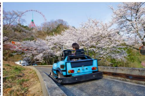
F-1 カートで“お花見ドライブ”