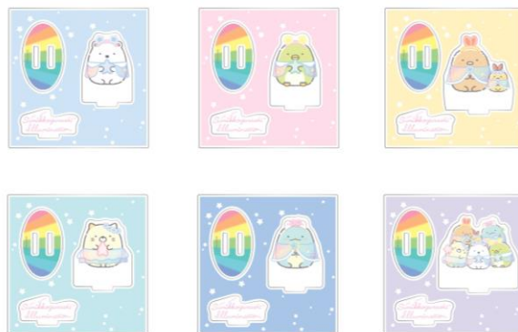
ブラインドアクリルスタンド (全6種) 各税込 850 円