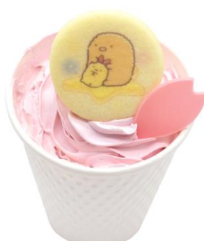
さくらストロベリーオレ 税込 700 円