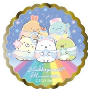
ピンバッジ 税込 750 円