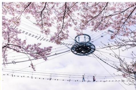
風天で体験する“絶叫お花見”