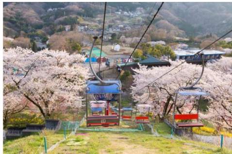
絶景のリフトで“空中お花見”

「ペアリフト」では、斜面一面に咲く桜のほか、桃、レンギョウ、山吹などの色鮮やかな景色を楽しめる“空中お花見”、標高 370m にそびえたつ絶叫吊り橋「風天」や絶叫アトラクション「極楽パイロット」では桜を見下ろしながら楽しむ“絶叫お花見”、自走式カート「F-1カート」に乗れば“お花見ドライブ”が楽しめます。アトラクションに乗ってお花見を楽しめるのは、さがみ湖リゾート プレジャーフォレストならではの。さがみ湖桜まつり WEB サイト https://www.sagamiko-resort.jp/events/sakura.html