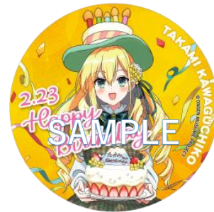
コースター(イメージ)