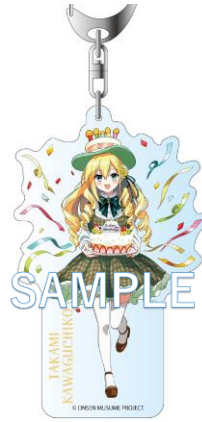
アクリルキーホルダー