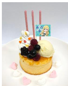
バースデーパンケーキ