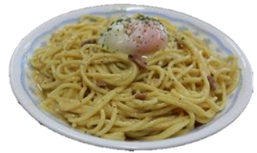
とろんたま on カルボナーラ 950円