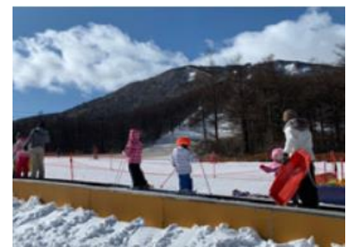
リフト乗車時は間隔をあげお並びいただく