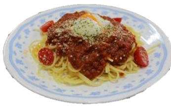
とろんたま on ミートスパ 950円