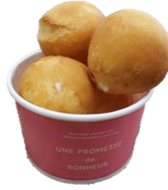
チーズボール(4個入) 450円