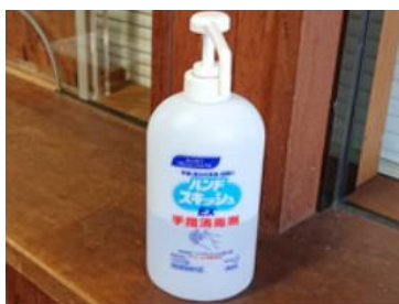
アルコール消毒液の設置

詳細はこちら: http://www.adatarara-resort.com/ski/safety.stm