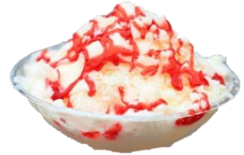
あだたらスノーアイス 500円 (ストロベリー・ピーチ・チョコ味)