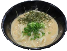
明太クリームうどん 850円