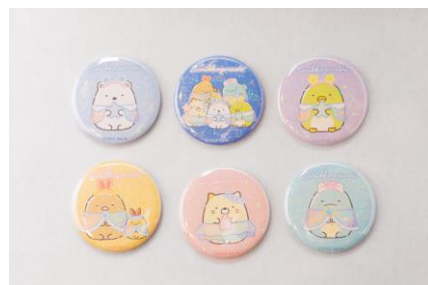
ブラインド缶バッジ (全 6 種) 500 円