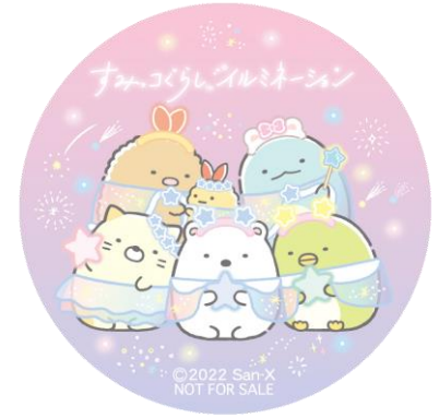
※缶バッジイメージ