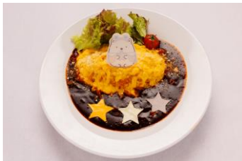
みんな大好き！しろくまの デミオムライス 1,800 円