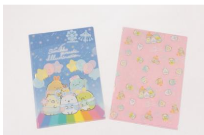
A4 クリアファイル (2 枚 1 セット) 700 円