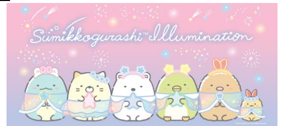
※バスタオルイメージ

遊園地に隣接する、手ぶらでキャンプを楽しめるアウトドア施設「PICA さがみ湖」では、オリジナルバスタオルと、シールラリーイベント体験がついた特別キャンププランが登場します。お昼は遊園地でたっぷり遊び、夜はすみっこぐらしイルミネーションを楽しんだあとはそのままゆったりとお泊りいただけるプランです。※詳細は決定次第 WEB サイトでお知らせいたします。