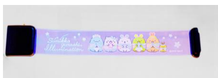
光るブレスレット 900 円