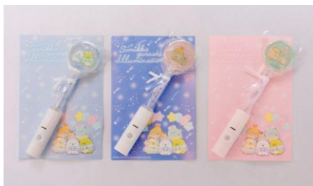
光るキャンディ (全 3 種) 680 円