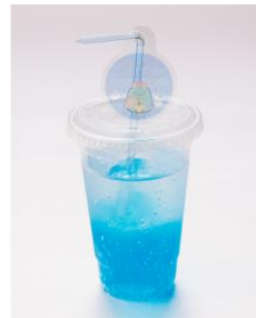
しゅわしゅわすみっコド リンク (全 5 種) 700 円 ※ストローチャーム付き