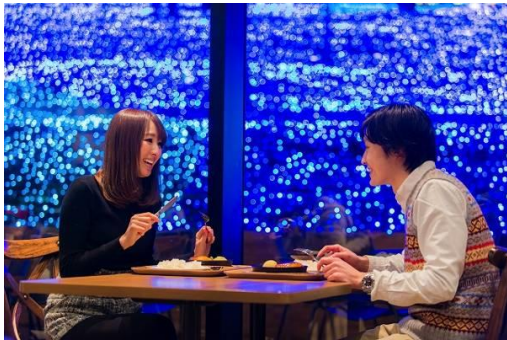
レストラン「ワイルドダイニング」

園内中心部にあるレストラン「ワイルドダイニング」では、イルミネーションの幻想的な景色を楽しみながら温かい料理をお楽しみいただけるほか、日帰り温泉施設「さがみ湖温泉うるり」も隣接しており、“イルミネーション”と“温泉”という冬の醍醐味を満喫することもできます。また、隣接するアウトドア施設「PICA さがみ湖」では、BBQ や焚火など、家族や友達と思い思いの時間をゆったりとお過ごしいただけます。