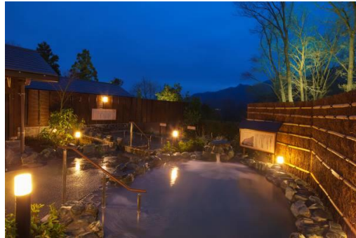
さがみ湖温泉うるり