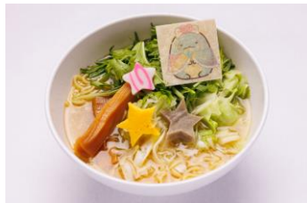
とかげのすみっ湖風 塩ラーメン 1,700 円