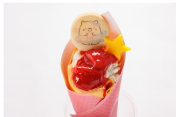
ねこのいちごクレープ 900 円