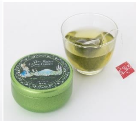
プチ缶入り日本茶 770 円