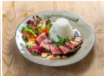
彩りローストビーフプレート 2,500 円