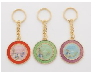
リング型キーホルダー 各 550 円

36 種類のデザインから選べる「リング型キーホルダー」をはじめ、絵本の形をしたパッケージが特徴の「ほろりんしょこら」、英国の老舗テキスタイルブランド「リバティ・ファブリックス」とコラボしたリバティ柄の生地を使用した「ランチトート」、コーヒーカップやプレートといった日常にお使いいただける食器類など、ここでしか買えない可愛さ満点のオリジナルグッズが多数登場いたします。さらに、7 月 16 日(土)より始まる夏営業にあわせて、オリジナルグッズのバリエーションがさらに増えますので、ぜひご期待ください。