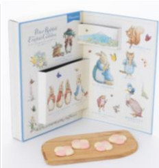
ほろりんしょこら 950 円