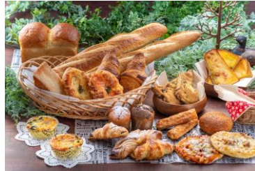
パン各種 300 円～