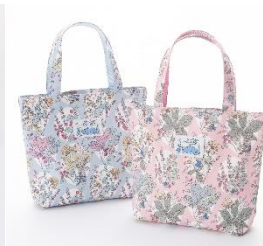
リバティプリントランチトート 各 4,600 円