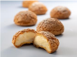
シュークリーム 500 円