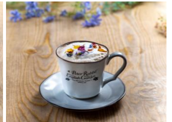
フラワリーラテ 800 円