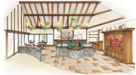
※画像は全てイメージ