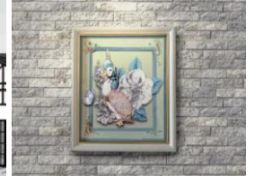
キャラクターフレームイメージ