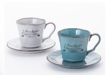
コーヒーカップ 各 2,530 円