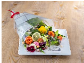
マグレガーおじさんの とれたて野菜のブーケサラダ 1,500 円