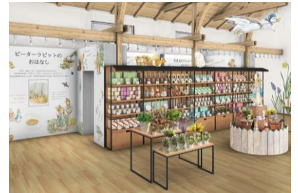
ショップ&ギャラリーイメージ

ショップ内にあるギャラリーでは、『ピーターラビットのおはなし』をはじめ、『赤りすナトキンのおはなし』や『かえるのジェレミーのおはなし』といった5つのおはなしをテーマに、絵本の世界に入り込んだかのような体験ができます。なお、絵本の翻訳は早川書房より新たに刊行される絵本<ピーターラビット™>シリーズの翻訳を手がける小説家・詩人の川上未映子氏に特別に翻訳をしていただきましたので、ご期待ください。