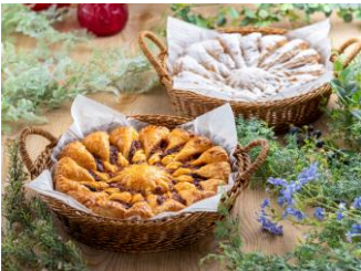
ブルームパイ 各 3,000 円 上:ホワイトチョコ×ベリーソース 下:ミートソース