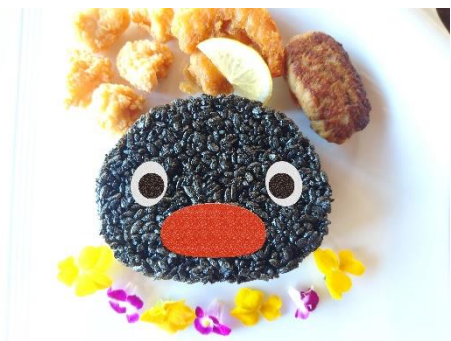
PINGU~ガーリックシュリンプセット~ 1,500円(税込)

【ピングーコラボメニュー (イメージ)】 ※実際の提供メニューは写真と異なる場合があります。