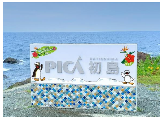
海岸沿いフォトスポット (イメージ)