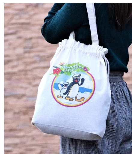
巾着トートバッグ（イメージ）