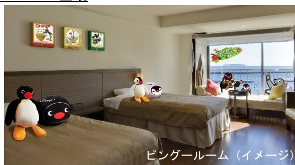
ピンゲールーム（イメージ）

熱海サンビーチ沿いに位置する全室オーシャンビューの温泉リゾートホテル「熱海シーサイドスパ&リゾート」に、ピンゲーコラボルームが2部屋限定で登場いたします。コラボルームにご宿泊のお客様しか手に入らないプレミアムなアロハシャツとアイマスクを身に着けて、たくさんのピンゲーやなかまたちに囲まれながら、ウェルカムスイーツに舌鼓…というとおきのプライベートタイムをお過ごしいただけます。