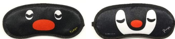
アイマスク（イメージ）

★特典①★ コラボルームにご宿泊の方に、女性に人気のフルーツ柄イラストが散りばめられたアロハシャツと寝顔のピンゲーとピンガが両面にプリントされたアイマスクをプレゼントいたします。どちらもここでしか手に入らない数量限定のプレミアム品です。