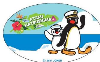
缶バッジ (イメージ)