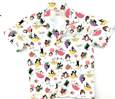
アロハシャツ（イメージ）