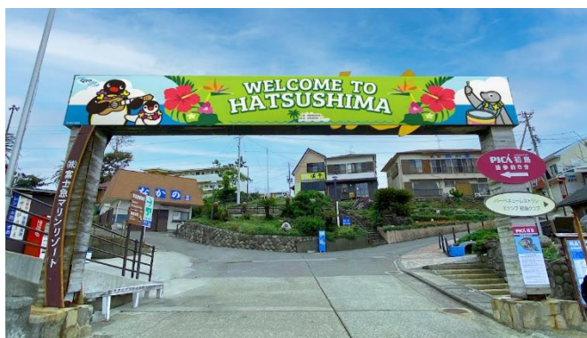
初島港ウェルカムゲート (イメージ)

南国感満載のピンゲーやなかまたちが出迎えてくれるウェルカムゲートや、どこまでも広がる海をバックにピンゲーやピンガと記念撮影が楽しめるフォトスポットが登場いたします。