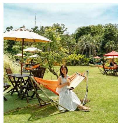
アジアンガーデン R-Asia

★特典★ コラボメニューをご購入の方に、南国リゾートを楽しむピングー、ピンガ、ロビのオリジナルイラストが描かれたステッカー(全3種)をプレゼントいたします。 ※1会計につき1枚、ランダムでのお渡しとなります。