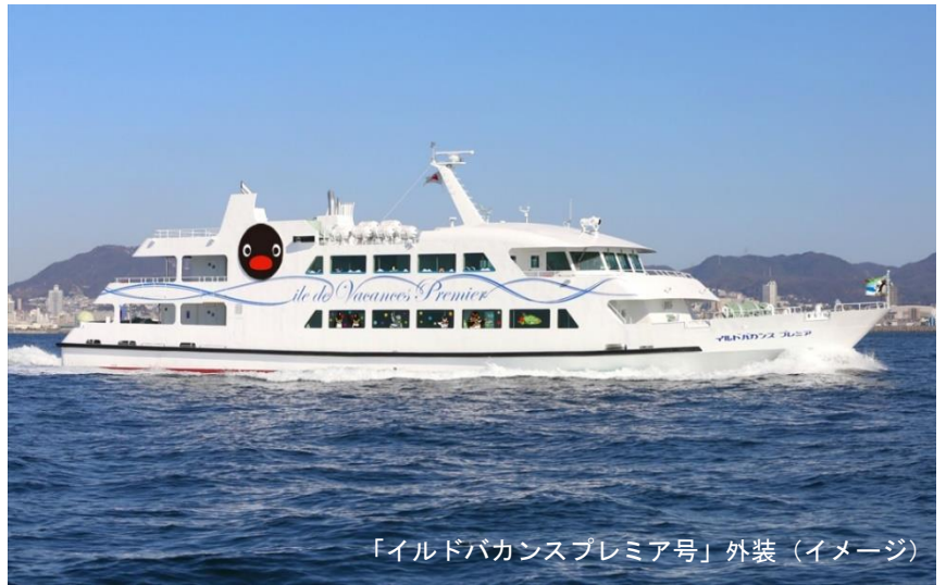
「イルドバカンスプレミア号」外装（イメージ）

静岡県熱海市にて熱海～初島航路を運航する株式会社富士急マリリゾートでは、スイス生まれの人気キャラクター「PINGU（ピングー）」の40周年を記念して、2021年12月4日（土）～2022年2月23日（水祝）の期間、コラボイベントを初開催いたします。