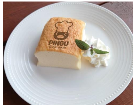
PINGU~台湾カステラ~ 600円(税込)