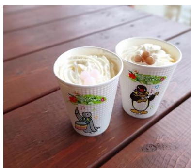
PINGU~タピオカドリンク~ (ホット/アイス) 700円(税込)