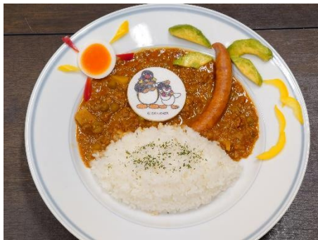
PINGU~初島カレー~ 1,500円(税込)