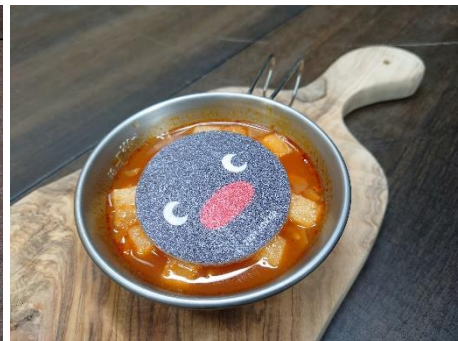
PINGU~ミネストローネ~ 600円(税込)