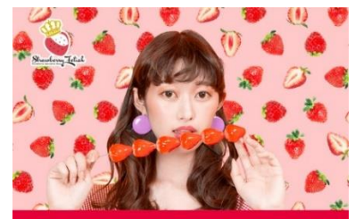
ストロベリーフェチ(イメージ)