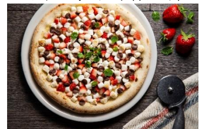
MACARONI CLUB「いちごマシュマロピザ」