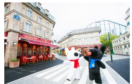
グリーティング(イメージ)