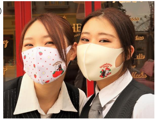
「Strawberry Festa」限定デザインマスク

タウン内店舗で1会計につき3,000円以上お買い上げ(合算不可)の方に「ストロベリーフェスタ」オリジナルデザインのマスクをプレゼントするマスクバイキャンペーンを実施いたします。さらに、本年パティシエ押しメニューの「いちごのパブロバ」または「いちごのアフタヌーンティーセット(土日祝日限定販売)」をご購入のお客様の中から抽選で1名様に「ハイランドリゾートホテル&スパペア宿泊券(富士急ハイランドフリーパス付)」が当たるキャンペーンも開催いたします。 ※マスクは数量限定です。無くなり次第終了となります。