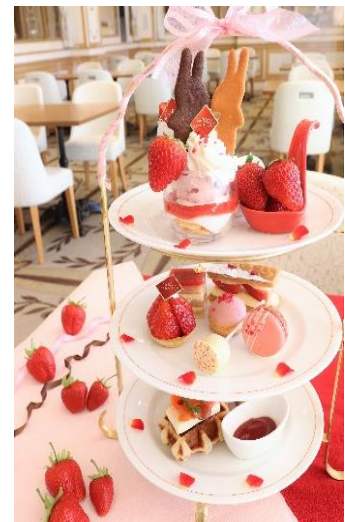
レ レーヴ サロン・ド・テ 「いちごのアフタヌーンティーセット」