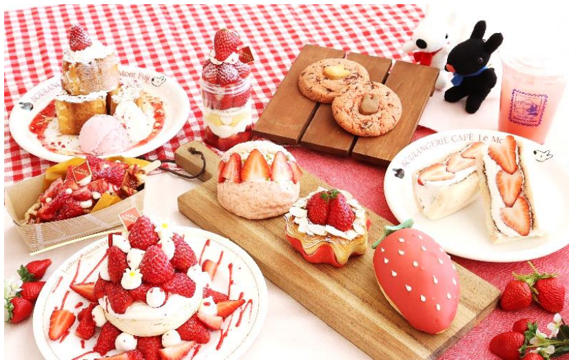
リサとガスパール タウン ストロベリーメニュー(イメージ)

さらに、富士急ハイランド園内のスナック店舗やハイランドリゾートホテル&スパのイタリアン「MACARONI CLUB (マカロニクラブ)」でも各店舗オリジナルのいちごメニューを販売するなど、至る所でお腹いっぱいお楽しみいただけます。