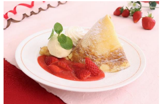
パティシエ特製「いちごクレープ」のレシピを公開

遠隔地にお住いの方や外出が不安な方がご自宅でもお楽しみいただけるよう、お家で作れるパティシエ特製「いちごクレープ」のレシピ公開や「イチゴジャムとラスクセット(2,000円 ※送料別)」のオンライン販売も実施いたします。リサとガスパール タウン公式ホームページ内「ストロベリーフェスタ」特設ページより、ぜひご覧ください。