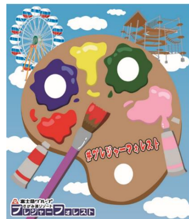
▲パレットのような顔出しパネルで絵具に変身！