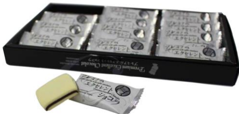
プレミアムエクセレントシヨコラ 通常 680円 → 550円

3月31日(水)までの期間中、お土産売店「プレジャーステーション」にて、チョコレートや光るアメなどの一部商品を学生の方は割引価格でご購入いただけます。レジにて学生証の提示が必要です。