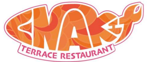
※テラスレストラン「ENAK(エナ)」ロゴ