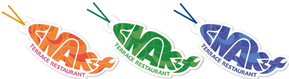
※「ENAK オリジナル葉」イメージ

オープニングキャンペーンとして、「ENAK(エナ)」ご利用のお客様に、ロゴをモチーフにした「ENAK オリジナル葉」をプレゼントいたします。旅の思い出として、お持ち帰りください。