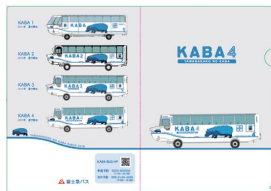
「KABA4」オリジナルクリアファイル

カババスの写真をSNS (Facebook、Twitter、Instagram など) 投稿いただき、カバの窓口（山中湖旭日丘バスターミナル2階）にて投稿画面を提示していただいたお客様に新車両「KABA4」が掲載されたオリジナルクリアファイルをプレゼントいたします。 ※投稿いただく写真は「KABA4」だけではなく「KABA1」、「KABA2」、シアタールームの写真なども可。（先着1,000名様）