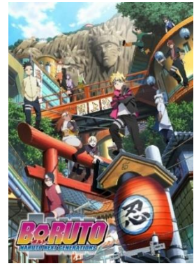
「BORUTO-ボルト- NARUTO NEXT GENERATIONS」 イメージ

また、「BORUTO-ボルト- -NARUTO NEXT GENERATIONS-」は、Vジャンプ(発行:集英社)にて連載されている「NARUTO」のその後を描くスピンオフ作品。里のリーダー“火影”となったうずまきナルトの息子「ボルト」を主人公として、近代化が進んだ“木ノ葉隠れの里”を舞台に物語が描かれる。2017年よりテレビ東京系にてアニメ放送中。