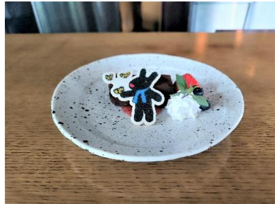
ガスパールの濃厚チョコレートケーキ 850 円