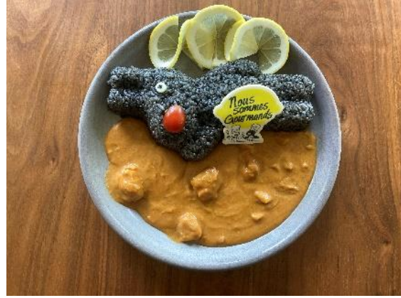
ガスパールのレモンチキンカレー 1,700 円