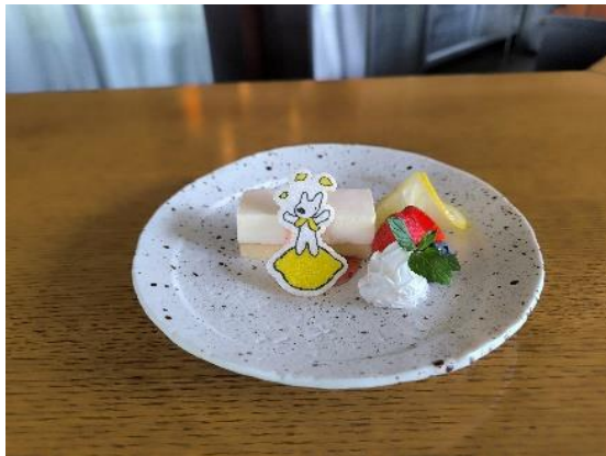
レモン香る リサのチーズケーキ 850 円