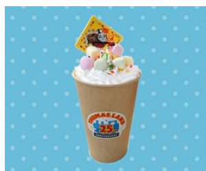
ミルクチョコココア 600円