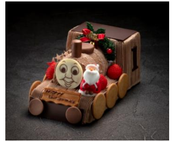
トーマスサンタのクリスマス ※限定 30 台