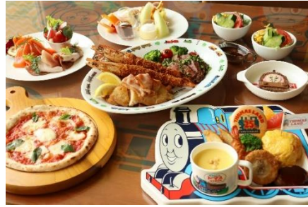
トーマス・パーティーセット