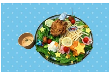
トーマスとなかまたちの フライドチキンクリスマスプレート 1,800円