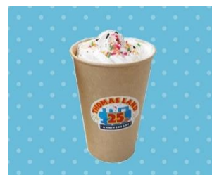
ホットチョコレートラテ 600円