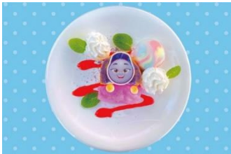
カナのロールケーキと 「わあ！」たあめのデザート 900円