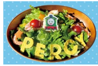
パーシーのグリーンポテトサラダ 900円