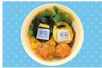
ファローナ&フレデリコのチキンボウル (スーベニアボウル付) 1,650円