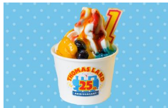
ソーダ島ミニサンデー マンゴー&ブルーベリー 600円