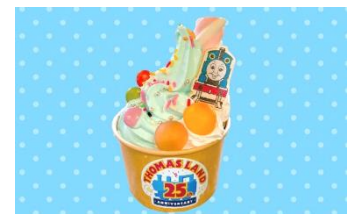
トーマスのミニサンデー 650円