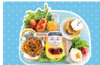
レベッカのお子様プレート (スーベニアバンブープレート付) 2,000円