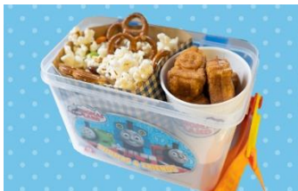
トーマスランドスペシャルボックス 1,800円