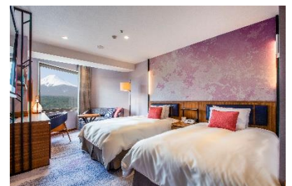
ハイランドリゾート ホテル&スパ (客室イメージ)