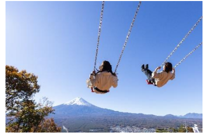
富士山パノラマロープウェイ「絶景ブランコ」

2 月 23 日(木祝)の「富士山の日」当日、富士急グループの対象各施設にて感謝の大還元祭を開催いたします。各施設の SNS フォロー画面のご提示で、利用料が無料になる抽選会へのご参加や先着“23 名様”の無料サービス、“223 円”“2,230 円”“3,776 円”の特別メニュー・商品の販売など、富士山にちなんだ数字で、この日だけのお得やお楽しみが盛りだくさんです。地元の皆さまも富士山観光の方もぜひこの機会にお越しください。