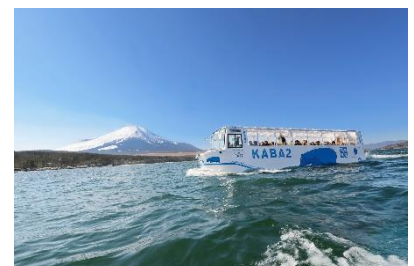
水陸両用バス「山中湖のカバ」