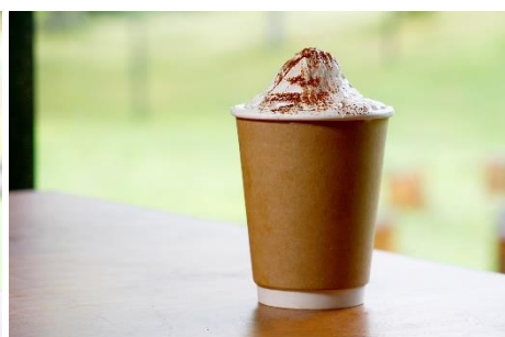
富士山ラテ(フジヤマコーヒー使用) 550 円