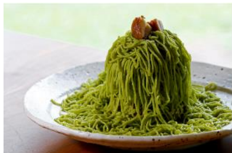
1059 モンブラン(静岡茶使用) 1,000 円