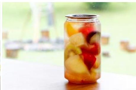
1059 fruits 780 円