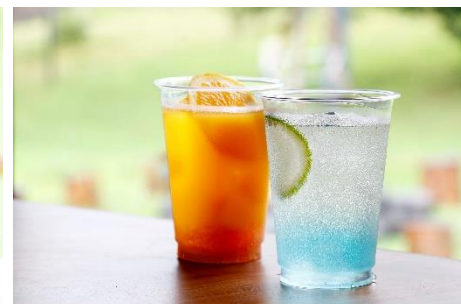
TENGOKU DRINK(左:夕暮れ/右:空) 各 500 円