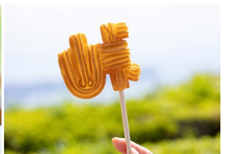
峠チュロス 500 円