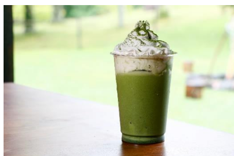
TENGOKU ラテ(小柳津製茶天空抹茶使用) 600 円