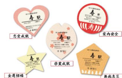
寿駅祈願入場券 各200円