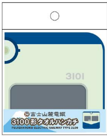
3100 形タオルハンカチ 660 円