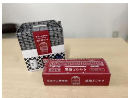
黒糖どらやき（5個入り）1,350円