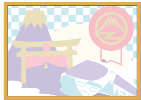
切り布モザイクアート 下絵イメージ