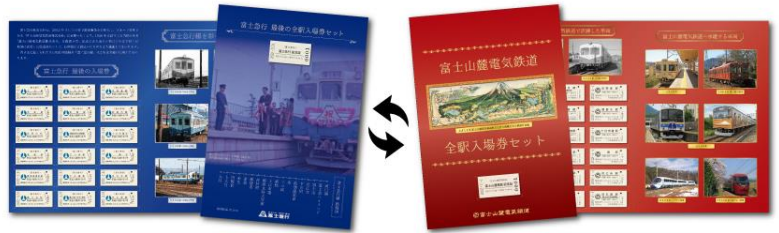
富士急行全駅入場券セット