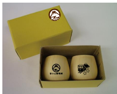
ぐい飲み2個セット 1,300円

富士山麓電気鉄道の開業にちなんでオリジナルグッズを販売いたします。富士急行と富士山麓電鉄の入場券がセットになった1冊で新旧対比が楽しめる、「全駅記念入場券セット」や、水晶の産地として有名な山梨の宝飾品を活かした「宝石入場券」、地元のメーカーとコラボした記念商品など、今後も鉄道会社の域を超えたオリジナル商品が続々登場予定です。