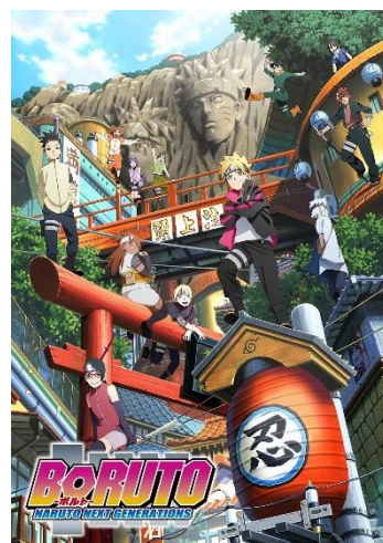
「BORUTO-ボルト- NARUTO NEXT GENERATIONS」イメージ

また、「BORUTO-ボルト- -NARUTO NEXT GENERATIONS-」は、Vジャンプ（発行：集英社）にて連載されている「NARUTO」のその後を描くスピンオフ作品。里のリーダー“火影”となったうずまきナルトの息子「ボルト」を主人公として、近代化が進んだ“木ノ葉隠れの里”を舞台に物語が描かれる。2017年よりテレビ東京系にてアニメ放送中。