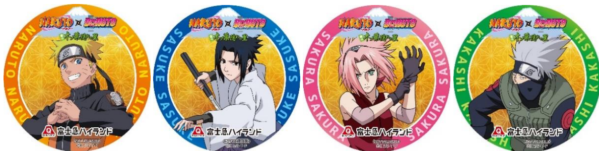
※第七班メンバーのホログラムステッカー 全4種（ランダムでお渡しいたします）