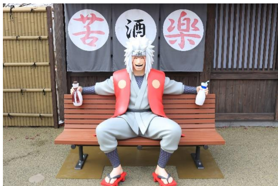
主人公ナルトの師「自来也(じらいや)」は大好きな酒を両手にほろ酔いでご満悦

富士急ハイランド(山梨県富士吉田市)にある「NARUTO×BORUTO 富士 木ノ葉隠れの里」に、明日12月4日(金)、「NARUTO-ナルト- 疾風伝」に登場する自来也・綱手・我愛羅・イタチといった人気キャラクターたちの新フォトスポットが登場いたします。