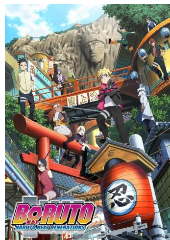
「BORUTO-ボルト- NARUTO NEXT GENERATIONS」 イメージ

また、「BORUTO-ボルト- -NARUTO NEXT GENERATIONS-」は、V ジャンプ（発行：集英社）にて連載されている「NARUTO」のその後を描くスピンオフ作品。里のリーダー“火影”となつたうずまきナルトの息子「ボルト」を主人公として、近代化が進んだ“木ノ葉隠れの里”を舞台に物語が描かれる。2017 年よりテレビ東京系にてアニメ放送中。