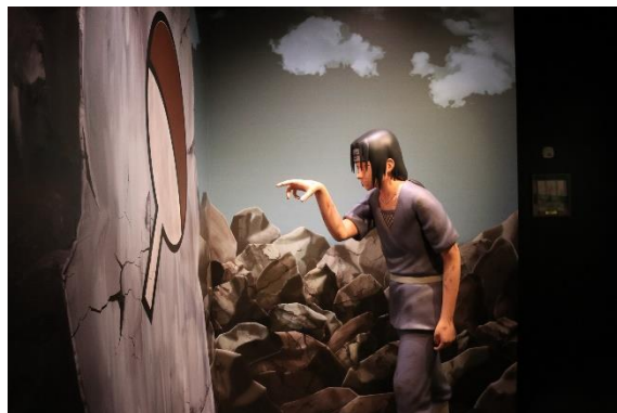
「うちはイタチ」は弟・うちはサスケとの感動シーンを再現

作品に登場するお馴染みのポーズと一緒に記念撮影をすれば、NARUTOの世界観により一層浸れること間違いなしです。なお、里内の「ラーメンー楽」では、「我愛羅」をイメージした「我愛羅“砂の絶対防御”白胡麻担々麺」を販売しております。我愛羅の額と同じ“愛”の文字が刻まれた煮卵やたつぷりの白胡麻で“砂”を表現した寒い冬にほっと温まる逸品です。ぜひご賞味ください。