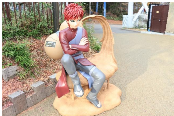
ひょうたんから飛び出す砂に腰掛ける風影「我愛羅(ガアラ)」