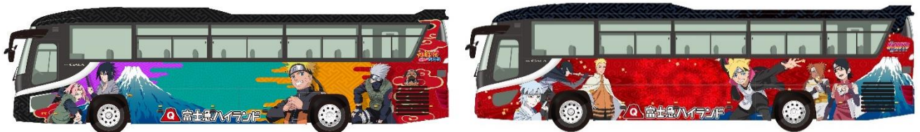
※ラッピングバスイメージ（2 台運行）