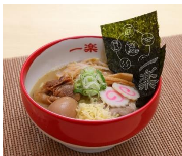
忍 五大国らーめん 1,380円