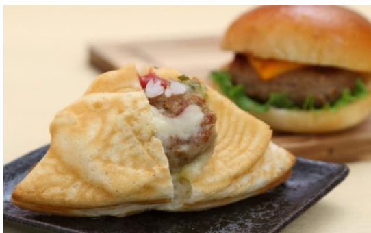
ボルトの「チーズバーガーたいやき」 400円