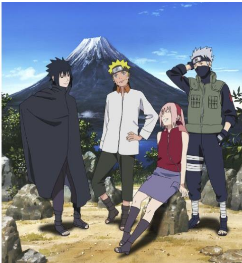
※ナルトの他第七班のメンバー