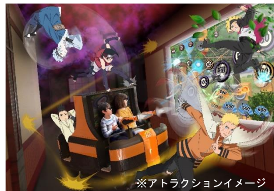
※アトラクションイメージ