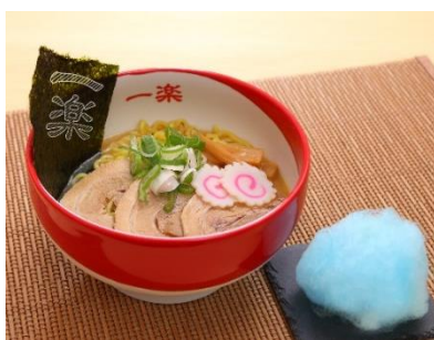
一楽らーめん NARUTO 螺旋丸スペシャル （綿あめ付） 1,280円