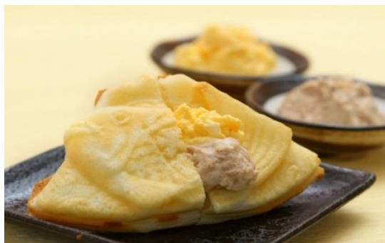
サラダの「ツナたまごサラダたいやき」 400円