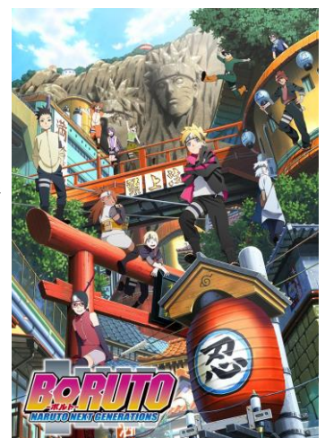
「BORUTO-ボルト- NARUTO NEXT GENERATIONS」 イメージ

また、「BORUTO-ボルト- -NARUTO NEXT GENERATIONS-」は、同誌にて 2016 年から連載されている「NARUTO」のその後を描くスピンオフ作品。里のリーダー“火影”となったうずまきナルトの息子「ボルト」を主人公として、近代化が進んだ“木ノ葉隠れの里”を舞台に物語が描かれる。2017 年よりテレビ東京系にてアニメ放送中。