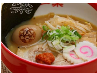
サスケの「豪火球」辛味噌らーめん （写輪眼味玉付） 1,280円