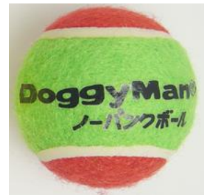
ノーパンクボールをプレゼント