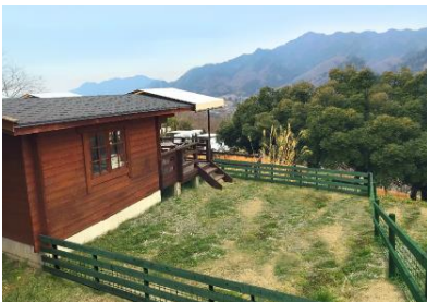
ログキャビンデラックス・ドックラン付