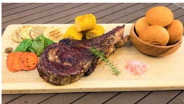
ワンワン！トマホークステーキ 11,000円(税込) (+愛犬専用おやつ1個付き)