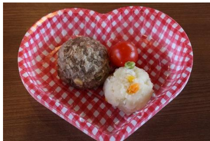
ワンちゃんのハンバーガーランチ