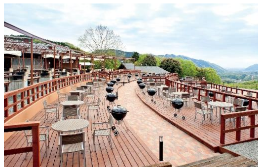
ワイルドクッキングガーデン