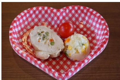
ワンちゃんの チキンロールランチ

園内レストラン「ワイルドダイニング」にて愛犬用のごはんを販売しております。愛犬と一緒に楽しいお食事の時間を過ごしましょう。 ※ワイルドダイニングテラス席のみとなります。 各 700円(税込)