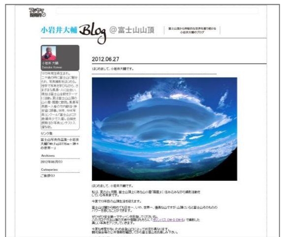
特集ページ（山頂ブログ）