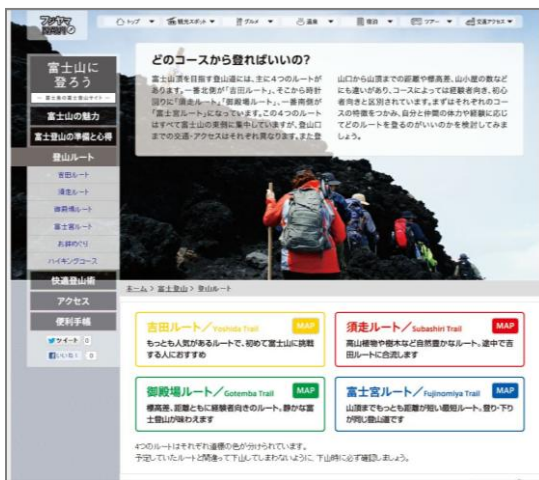
特集ページ（富士登山）