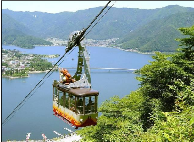
カチカチ山ロープウェイ