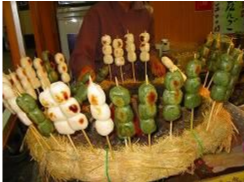
(たぬき団子イメージ)