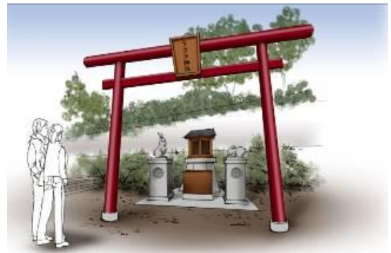
(うさぎ神社イメージ)

両脇には狛犬ならぬ「狛うさぎ」が2体おり、頭を伏せている「夢見兎」の頭をなでると“知恵授受”、後ろ脚で立ち上がっている「富士見兎」の脚をなでると“健脚”と、それぞれ思いを込めて配しております。