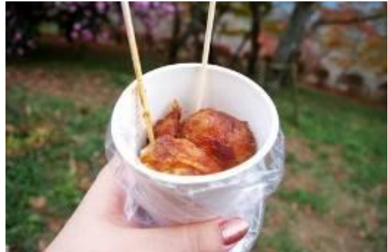
(甘辛いもイメージ)