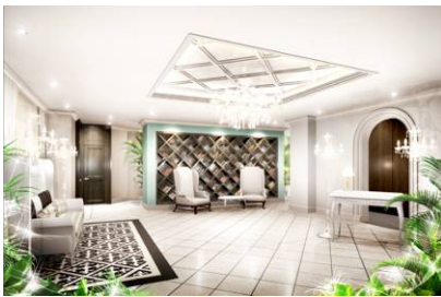
コンシェル・クロック