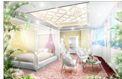
ブライダルスイートルーム