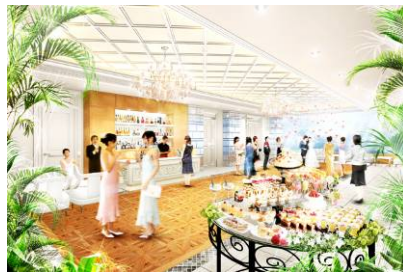
ウェルカムラウンジ&amp;カフェ