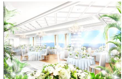
バンケットホール（最大収容人員 98名）