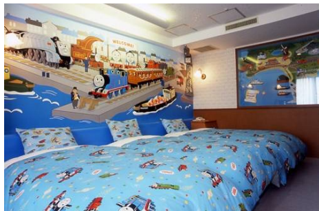
豪華客船と港をテーマにしたお部屋

65 周年の記念すべき年に、今後も様々な企画をご用意いたしますので、どうぞご期待ください。