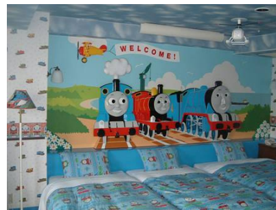
ゴードンの丘のお部屋

本件についてのお問い合わせは、ハイランドリゾート(株)企画部 川瀬、外川 TEL 0555-22-1181 FAX 0555-22-3110 www.highlandresort.co.jp