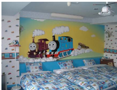
トーマス&レディーのお部屋